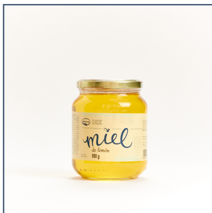
950 g - Vidrio