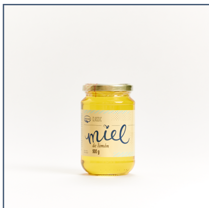
500 g - Vidrio